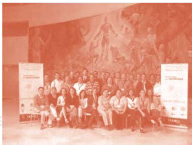
Participantes del Curso (profesores y alumnos).

El primer día después de la inauguración oficial a cargo de las autoridades del Instituto Nacional de Reumatología y la Universidad La Salle iniciaron las labores académicas y éstas estuvieron encaminadas a principios físicos del ultrasonido, caracterización tisular, hombro normal y patológico, botonología del equipo y redacción del informe ecográfico; además de talleres prácticos que reforzaron en todo momento la teoría, se formaron cinco grupos, con cuatro integrantes cada uno de acuerdo al nivel de conocimiento y la evaluación ini-