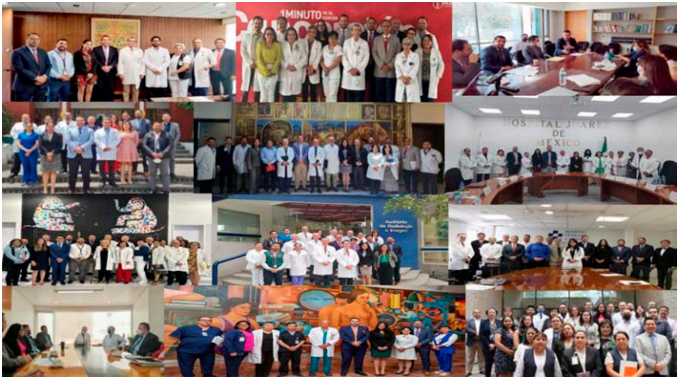
Figura 8: Colaboración de la CONAMED con Institutos Nacionales y Hospitales de Alta Especialidad.