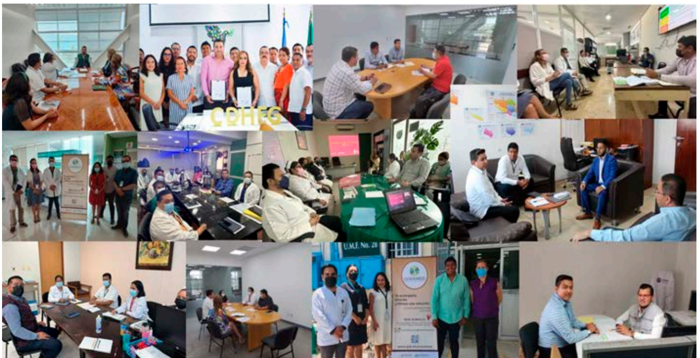
Figura 12: Vinculación de la CONAMED, sede Acapulco, con distintos organismos del Estado de Guerrero.

En el año 2002 se conformó el Consejo Mexicano de Arbitraje Médico, el cual con la integración de los titulares de las Comisiones Estatales de Arbitraje Médico (28 actualmente), de los estados de Aguascalientes, Baja California, Baja California Sur, Campeche, Chiapas, Chihuahua, Coahuila, Colima, Guanajuato, Guerrero, Hidalgo, Jalisco, México, Michoacán, Morelos, Nayarit, Nuevo León, Oaxaca, Puebla, Querétaro, San Luis Potosí, Sinaloa, Sonora, Tabasco, Tamaulipas, Tlaxcala, Veracruz y Yucatán, se fortalecen los mecanismos de colaboración