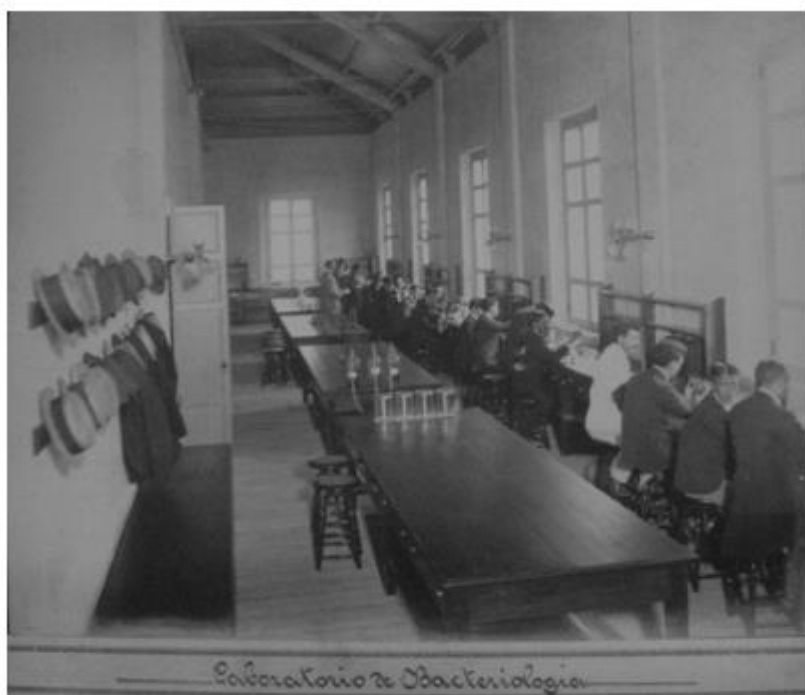
Fig. 3. Unidad documental simple.

FOTOGRAFÍAS QUE CONTIENEN EN LA PARTE INFERIOR LA IDENTIFICACIÓN DE LA IMAGEN (Fig. 3)