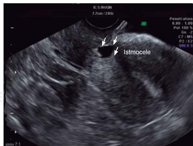
Figura 1. Ultrasonido ginecológico donde se muestra a nivel del istmo uterino colección triangular econegativa.

La prevalencia de istmoceles sintomáticos reportados en la literatura oscila entre 19.4 y 84%. 7 Los posibles factores de riesgo incluyen el número de cesáreas, la posición uterina, el trabajo de parto antes de la cesárea y la técnica quirúrgica utilizada para cerrar la incisión uterina. El cierre uterino de una sola capa produce más tensión en los tejidos en comparación con la técnica de doble capa. El sangrado postmenstrual es el síntoma más típico y molesto, y se caracteriza por la descarga de material hemático oscuro recogido en la bolsa de la cicatriz durante los días después de la menstruación. La presencia de istmocele puede ralentizar el drenaje de la sangre menstrual a través del cuello uterino y facilitar su