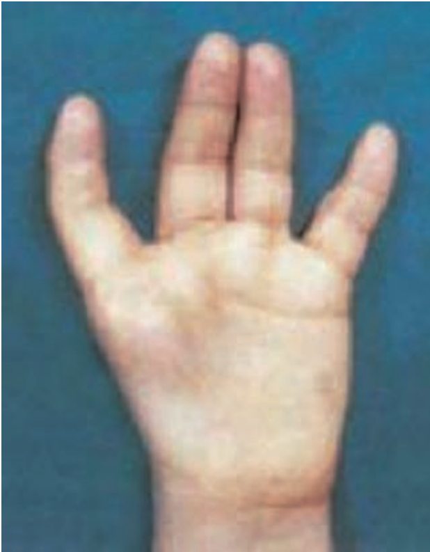
Figura 1. Ausencia de pulgar, hipoplasia tenar.

mayor prevalencia de la enfermedad debido a mutaciones fundadoras o con alta tasa de consanguinidad como en Israel 1 .