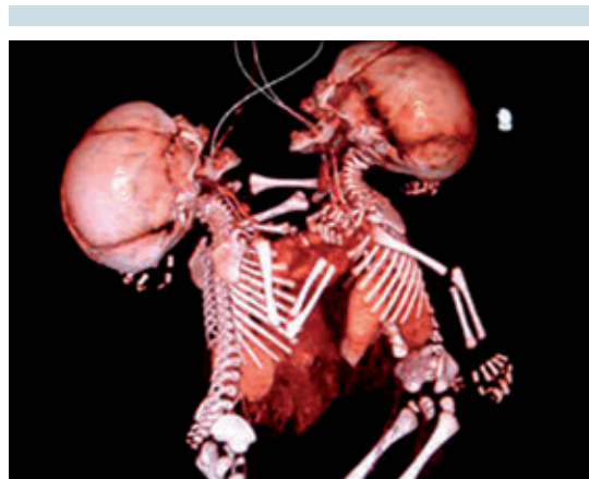
Figura 6. Reconstrucción tridimensional volumétrica que muestra ambos corazones emergiendo centralmente a través de la apertura amplia de las cajas torácicas. Los estómagos separados con sus correspondientes sondas nasogástricas se ubican a la izquierda de cada gemelo ( situs solitus ).

En el posoperatorio se tuvieron que emplear aminas. Debido a la tetralogía de Fallot y al hecho de haber tenido el tórax abierto, hubo