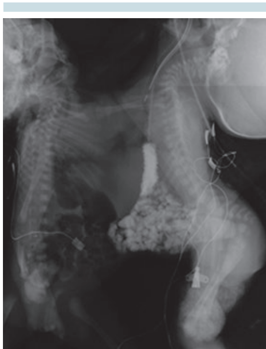
Figura 5. Serie esofagogastroduodenal. Se administró una pequeña cantidad de medio de contraste hidrosoluble a través de la sonda nasogástrica del gemelo 2; no compartían ningún segmento del tubo digestivo como ocurre en 50% de los casos.

no habría suficiente piel para cubrir las partes expuestas de cada gemelo, por lo cual se decidió que se colocarían expansores tisulares en la cara anterior de ambas parrillas costales. Se realizó el procedimiento quirúrgico posterior al cual presentó inestabilidad hemodinámica, que requirió el uso de aminas; 51 días después del ingreso se llevó a cabo la separación de órganos. La intervención duró diez horas, se colocó una malla de titanio en la pared torácica debido a la ausencia de la mitad de la parrilla costal que compartían los gemelos y no había suficiente piel para una cobertura adecuada.