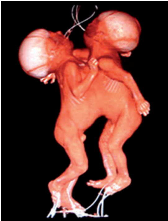
Figura 2. Reconstrucción tridimensional volumétrica de la tomografía computada multicorte, que muestra la superficie ventral de unión de los gemelos desde el esternón hasta el ombligo.