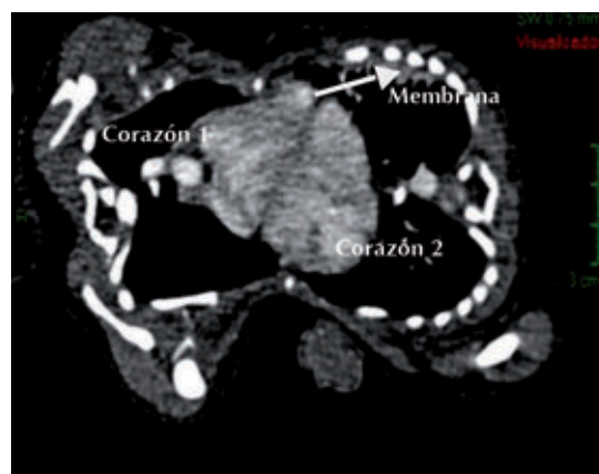
Figura 7. Corte axial de la tomografía computada en fase contrastada del tórax, que muestra la unión de ambos corazones.

compromiso circulatorio y necrosis del tejido circundante a la malla de titanio; se produjo distensión abdominal. La evolución fue tórpida, con anuria 48 horas después de la cirugía, hiperlactamia, hiperpotasemia e hipotensión, a pesar