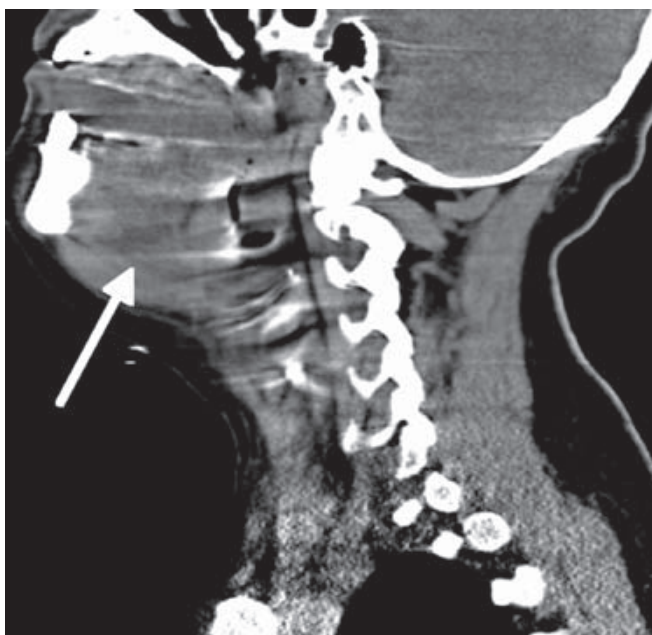
Figura 3. Escanografía contrastada de cuello. Reconstrucción coronal: obliteración de la grasa del rafe muscular por imagen con densidad de tejidos blandos, compatible con proceso inflamatorio.

camente los músculos de la base de la lengua. Se estableció monitoreo hemodinámico y clínico permanente.