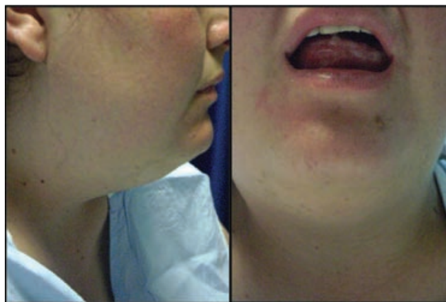
Figura 1. A. Edema de la región submandibular. B. Apertura bucal limitada con elevación de la lengua sobre el piso que la contiene.

Los datos del examen físico realizado cuando ingresó a urgencias fueron: frecuencia cardíaca 129x, frecuencia respiratoria 16x; temperatura 36°C; tensión arterial 135/86; SaO 2 92%; Glasgow 15/15. No tenía signos de dificultad respiratoria; estaba hidratada y afebril; toleraba parcialmente la posición en decúbito. La fonación era limitada; tenía una apertura oral de 1.5 cm, sialorrea abundante, edema de lengua dolorosa con escaso eritema, orofaringe sin lesiones y halitosis. Se observó tumefacción en la región submandibular bilateral diseminada a la región cervical (figura 1) y adenomegalias cervicales anteriores y submandibulares de