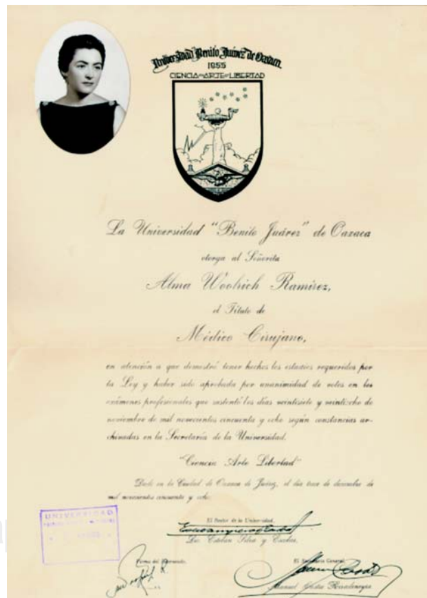
Figura 2. Título profesional de la Dra. Alma Woolrich.