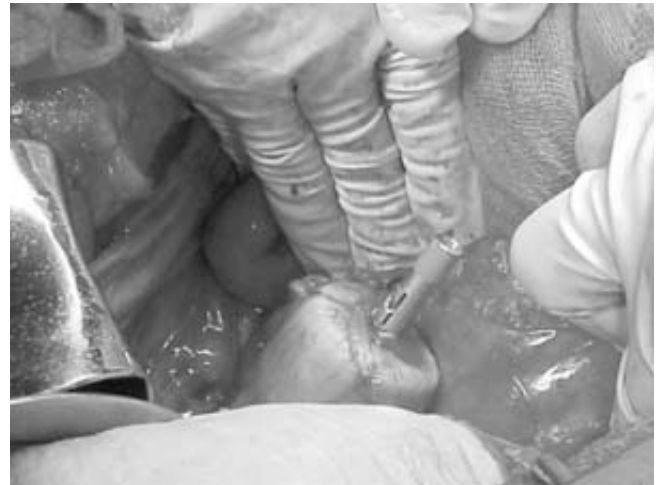
Figura 2. Introducción del cabezal de engrapadora circular por ano.

Una vez realizado el disparo se abre el dispositivo dos y media vueltas (sentido contrario a las manecillas del reloj) y con movimientos semicirculares gentiles se extrae por completo, inmediatamente se revisan los dos rodetes de tejido intestinal residual proximal y distal ("donas") verificando su integridad. Por último se realiza una prueba neumática, la cual consiste en la colocación de un clamp Glassman en la porción proximal de la anastomosis, llenándose a continuación la cavidad pélvica con solución fisiológica insuflando aire a través del ano por medio de un rectosigmoidoscopio o colonoscopio, a fin de verificar la permeabilidad de la anastomosis, así como identificando sitios de fuga al ejercer pre-