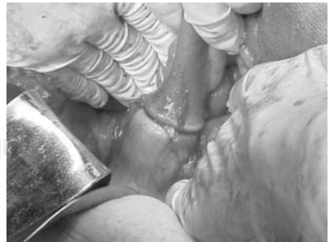
Figura 3. Doble engrapado terminado.

Cincuenta y cinco casos (37.6 %) fueron intervenidos por cáncer rectosigmoideo, 33 por enfermedad diverticular complicada (22.6 %), 20 casos de colitis ulcerosa crónica inespecí-