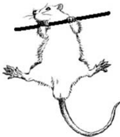
Figura 1. Capacidad de agarre de las patas delanteras.

A los 42 días de edad, un mismo observador realizó la valoración clínica que consistió en las siguientes pruebas: