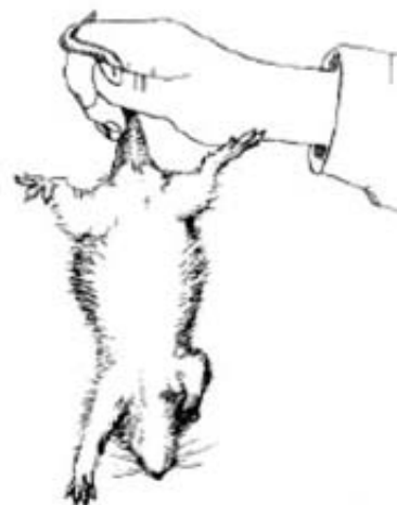
Figura 2. Respuesta alterada al reflejo posterior.

El peso de las ratas no siguió una distribución normal (Kolmogorov-Smirnov, p = 0.05 ). De acuerdo con la prueba de Kruskal-Wallis, los pesos promedio de los tres grupos no fueron significativamente diferentes ( p = 0.36 ) y, aunque los grupos estu-