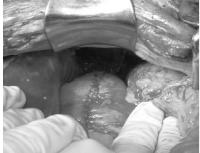
Figura 2. Resección de estómago y cierre con engrapadora.

Ante la sospecha de una fístula gastropleural, se realizó una prueba con azul de metileno, sin observar salida de este material por el tubo de toracostomía, sin embargo, ante evidencia de que el paciente continuaba con gastos con características de restos de alimento por el tubo de toracostomía, se decidió realizar tora-