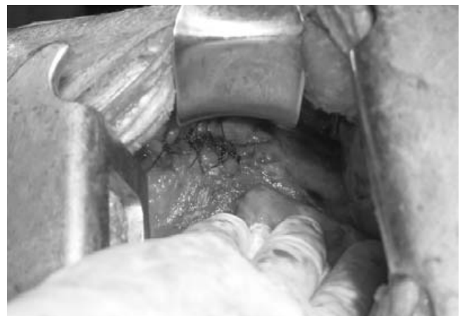
Figura 3. Cierre del orificio fistuloso con polipropileno del 1 en cavidad pleural.

cotomía de limpieza, en la cual se encontró abundante material de aspecto gástrico con restos de alimento. A la limpieza de la cavidad torácica se observó en el diafragma un orificio de aproximadamente 3 cm de diámetro, con protusión de mucosa gástrica (figura 1), por lo que se decidió laparotomía exploradora mediante la cual se apreció una porción del fondo gástrico abocado a través de un defecto en diafragma de aproximadamente 3 cm. Se realizó resección de esta porción gástrica y cierre con engrapadora lineal en un solo plano (figura 2), cierre del orificio en diafragma con puntos simples con polipropileno del 1, en la cavidad torácica con puntos simples con polipropileno del 1 (figura 3) y se colocaron dos tubos de toracostomía. El paciente evolucionó favorablemente en el posoperatorio, siendo extubado a las 24 horas y con expansión pulmonar de 95 % a las 48 horas; el primer tubo de toracostomía se retiró al tercer día de posope-