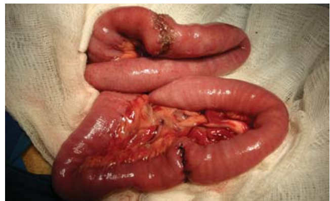
Figura 2. Reparación de las dos enterotomías.