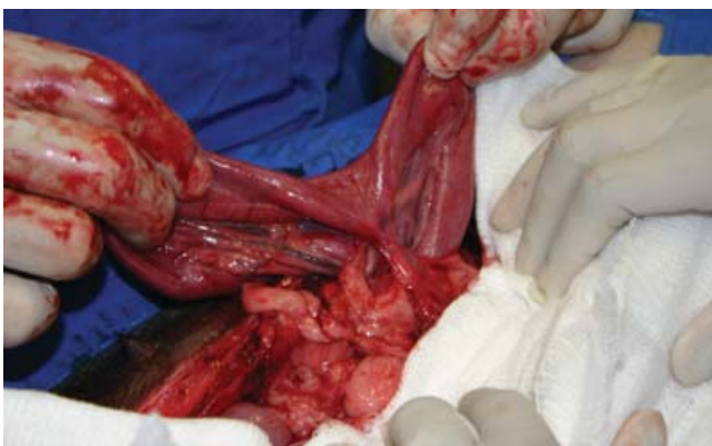
Figura 4. Adherencias entre el sitio de la reparación de una enterotomía y el epilón.