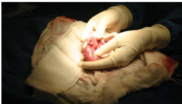
Figura 1. Enterotomía en el intestino delgado.

Todos los animales fueron sometidos a ayuno durante ocho horas preoperatorias y 17 horas posoperatorias. Luego se les dio dieta consistente en croquetas comerciales con un aporte calórico de 70 a 75 kcal/kg/día, reblandecidas en agua. Si no mostraban datos de obstrucción intestinal, distensión o vómito, luego