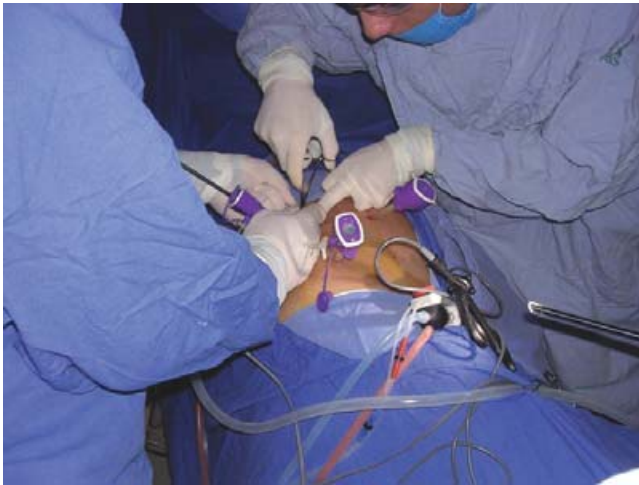
Figura 1. Posición del paciente y sitio de colocación de trócares.

(< 300 pg/ml), normetanefrinas en orina 580 pg/ml (<600), normetanefrina 27.8 pg/ml (< 90), metanefrinas totales en plasma 239 pg/ml (< 290).