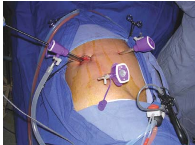
Figura 2. Acercamiento. Posición del paciente y sitio de colocación de trócares.

El paciente pasó su primer día posoperatorio en la Unidad de Cuidados Intensivos para su monitorización y fue egresado al tercer día sin recibir tratamiento antihipertensivo.