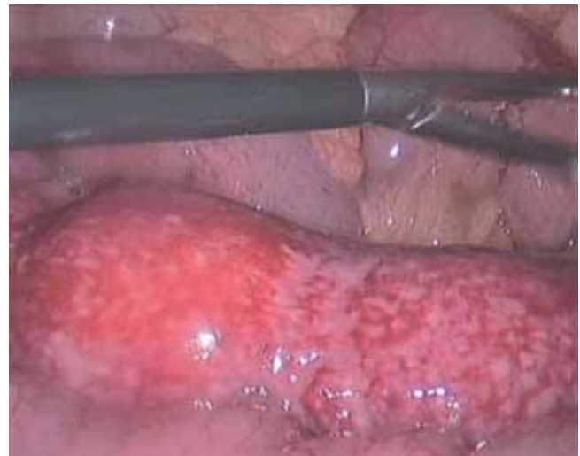
Figura 1. Segmento de asa intestinal con afectación irreversible por la enteritis.

Paciente masculino de 25 años de edad, sin antecedentes patológicos de interés, que ingresó al servicio de Cirugía General y Aparato Digestivo procedente de Urgencias debido a un cuadro de abdomen agudo, de 12 horas de evolución, con dolor abdominal localizado en el epigastrio e irradiado, posteriormente, a la fosa ilíaca derecha, acompañado de náuseas. En la exploración física el paciente se encontraba: cons-