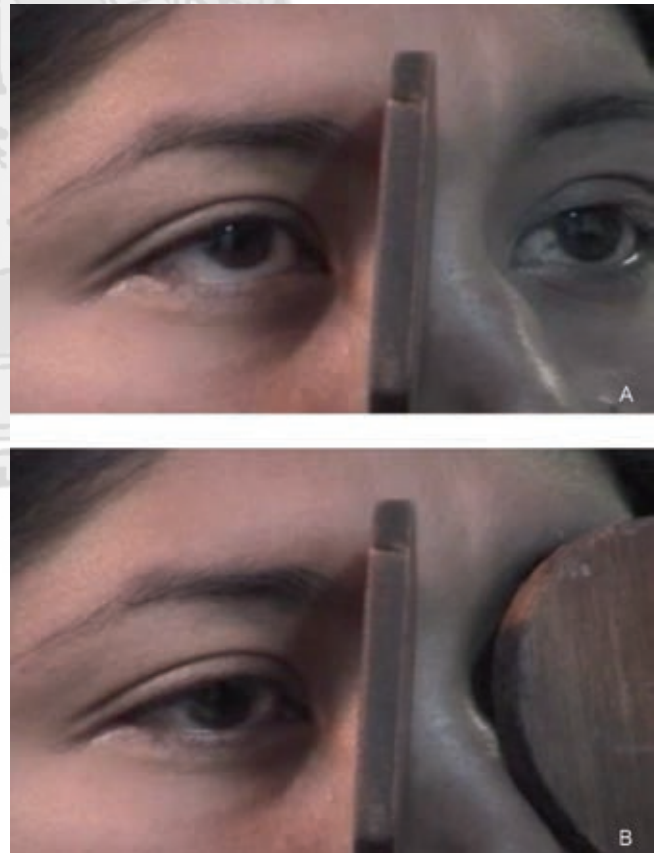
Figura 1. A. Ojo arriba por detrás del oclisor opaco. B. El ojo desciende al colocar el oclisor opaco enfrente del ojo fijador.

Con el objeto de dilucidar si la maniobra se comporta diferente al sólo modificar la fijación, pero permitir la entrada de luz a la retina, se consideró modificar la prueba utilizando oclisores translúcidos para comparar la magnitud