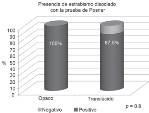
Figura 2. Estrabismo disociado con la maniobra de Posner.

ciona en la bibliografía científica. En la revisión a nuestro alcance sólo se refiere en un trabajo de Laria y sus colaboradores. 16 En el último decenio se retomó en el Hospital General de México. La prueba original se describió con el uso de ocluidores opacos. Sin embargo, después que en algunas investigaciones se demostró que la baja iluminación contribuía a hacer evidente el estrabismo disociado, 9 se consideró modificar la prueba utilizando ocluidores translúcidos que disminuyeran la cantidad de luz que recibe la retina pero, a su vez, permitiendo observar con más comodidad y a través del ocluidor el comportamiento del ojo ocluido.