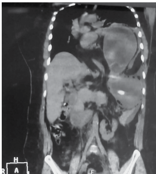
Figura 2. Tomografía simple toracoabdominal, corte coronal con imagen hipodensa en el hemitórax izquierdo que se comunica a la cavidad abdominal, con niveles hidroaéreos y engrosamiento de pared.

mático paraesofágico de 9 cm con saco herniario de contenido estómago, colon transverso y epiplón, y necrosis gástrica de 60% (en fondo y cuerpo) (Figuras 4, 5 y 6), por lo que se hizo