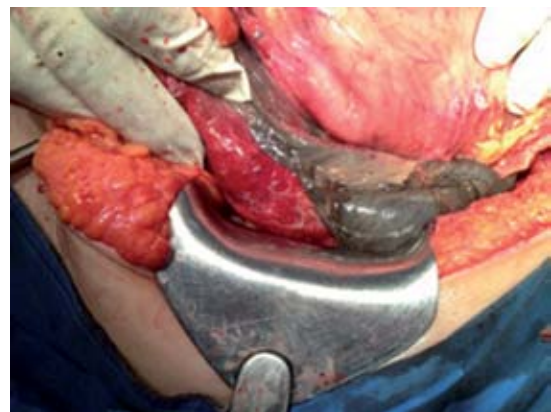
Figura 6. Límite de tejido sano de curvatura menor y tejido necrótico.

factoriamente, y el control radiográfico mostró características normales.