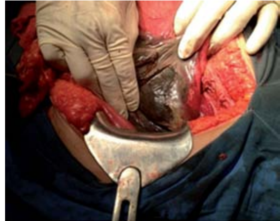
Figura 5. Necrosis de cuerpo gástrico.

La paciente permaneció durante el periodo posoperatorio inmediato en la unidad de cuidados intensivos, bajo apoyo mecánico ventilatorio, hemodinámicamente estable, sin aminas, con APACHE II de 10 y SOFA 1. Evolucionó satis-