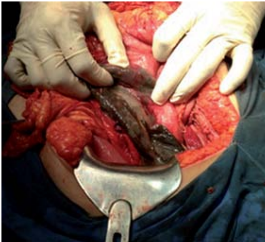
Figura 4. Necrosis de fondo gástrico.

resección gástrica no anatómica, con cierre en dos planos.