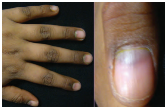
Fotografía 4. Melanoniua en paciente tratado con quimioterapia.

Las líneas de Muehrcke son una leuconiquia aparente, descrita en 1956 por Muehrcke. 19 Se caracterizan por la