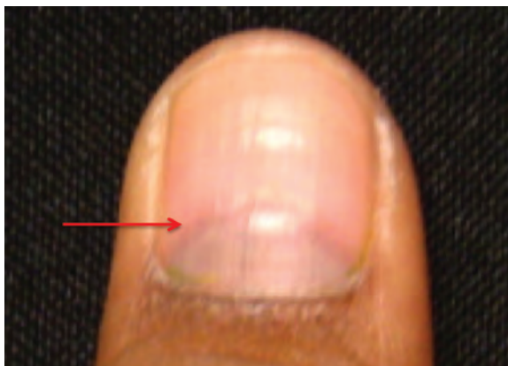
Fotografía 3. Líneas de Beau en paciente tratado con quimioterapia (CHOP).

Fueron descritas en 1846. Son surcos transversales en el plato ungual que provienen de la matriz y progresivamente se ubica distal a ésta conforme ocurre el crecimiento. Son causadas por cualquier enfermedad sistémica episódica lo suficientemente severa para alterar el funcionamiento normal de la matriz ungual. 2 El grosor de la línea orienta a la duración de la agresión. También pueden ser producto de un trauma, o bien de la exposición al frío en pacientes con fenómeno de Raynaud. Un caso clásico de líneas de Beau es el que deriva de manera secundaria de los agentes quimioterapéuticos; en general, todos pueden causarlas y su cantidad es directamente proporcional al número de ciclos. 12 Es posible estimar el momento en el que se produjo el estrés sabiendo que la uña crece en promedio 1 mm por semana.