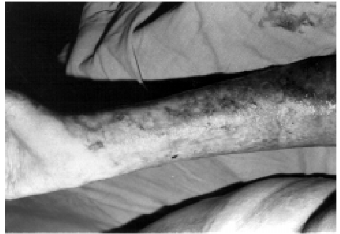
Figura 8. Antebrazo y mano, superficie palmar doce días después de la cirugía donde se aplicaron injertos mallados 6 a 1 cubiertos con aloinjertos de epidermis cultivada. Se aprecia epitelización completa entre el mallado.