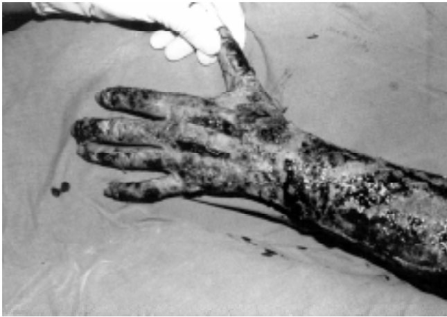
Figura 2. Aspecto de la mano y antebrazo en la superficie dorsal durante la primera cirugía, en la que se observan lesiones profundas y dermofasciotomías.

con dermofasciotomías en antebrazos y manos ( Figura 2 ), sin signos de síndrome compartimental y en regulares condiciones generales. Al tercer día de su ingreso, fue llevada a cirugía para realizar desbridación tangencial en las manos e injertar con piel de espesor parcial delgado, cubriendo las zonas donadoras con aloinjertos de epidermis cultivada procedentes de la Unidad de Cultivo de Epidermis, del Departamento de Biología Celular, del Centro de Investigación y Estudios Avanzados del IPN (CINVESTAV). Las quemaduras de segundo grado profundo localizadas en cara, tronco anterior y posterior y muslo izquierdo, fueron desbridadas y cubiertas con aloinjertos de epidermis cultivada. En ese mismo tiempo quirúrgico se realizó la resección de las escaras que cubrían