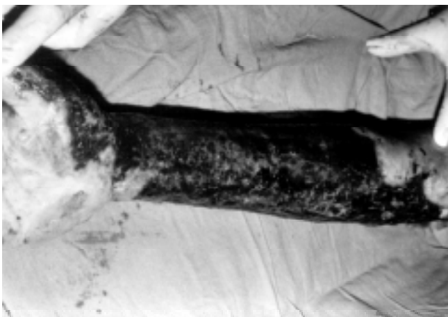
Figura 3. Aspecto de mano y antebrazo, superficie palmar durante la primera cirugía después de haber realizado desbridación.

con dermofasciotomías en antebrazos y manos ( Figura 2 ), sin signos de síndrome compartimental y en regulares condiciones generales. Al tercer día de su ingreso, fue llevada a cirugía para realizar desbridación tangencial en las manos e injertar con piel de espesor parcial delgado, cubriendo las zonas donadoras con aloinjertos de epidermis cultivada procedentes de la Unidad de Cultivo de Epidermis, del Departamento de Biología Celular, del Centro de Investigación y Estudios Avanzados del IPN (CINVESTAV). Las quemaduras de segundo grado profundo localizadas en cara, tronco anterior y posterior y muslo izquierdo, fueron desbridadas y cubiertas con aloinjertos de epidermis cultivada. En ese mismo tiempo quirúrgico se realizó la resección de las escaras que cubrían