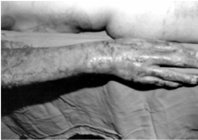
Figura 7. Antebrazo y mano, superficie dorsal doce días después de la cirugía donde se aplicaron injertos de espesor parcial delgado en mano y mallados 6 a 1 en antebrazo cubiertos con aloinjertos. Se observa completa integración de los injertos y epitelización entre el mallado.