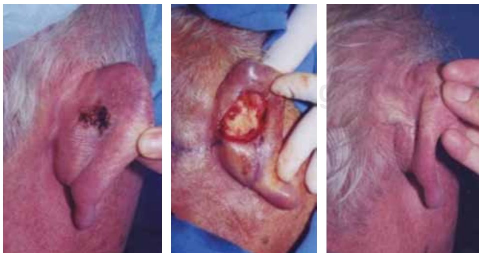
Figura 1. Resección del tumor con bordes amplios y cobertura mediante rotación de colgajo retroauricular.

CBC = carcinoma basocelular, CE = carcinoma epidermoide, R = resección, mm 2 = milímetros cuadrados resecados, C = colgajo, CQ = colgajo quesadilla, RC = resección en cuña, CD = cierre directo, ahélix = antihélix, der = derecho, izq = izquierdo.