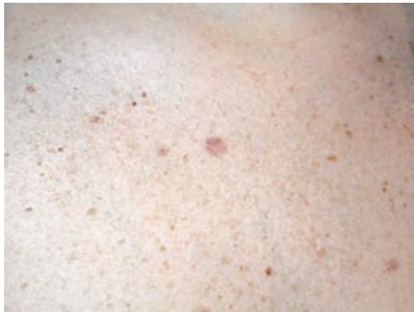
Figura 2. Imagen de carcinoma basocelular superficial previo a tratamiento con terapia fotodinámica.

La respuesta del condiloma acuminado a la TFD con ALA al 20% en crema y luz roja de 630 nm, no ha sido satisfactoria y hoy en día se reserva esta modalidad de tratamiento sólo a aquellos casos con respuesta inadecuada a otros tratamientos[82].