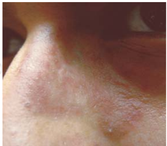
Figura 5. Mancha residual, 2 semanas de tratamiento.

La presentación clínica modificada puede dar muchas apariencias como eritema, placas pequeñas sin borde