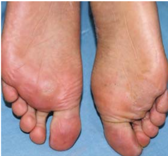
Figura 2. Escama fina en plantas con examen directo con filamentos.