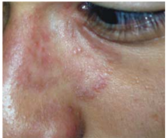
Figura 4. Mejoría, 1 semana de tratamiento.

Los esteroides actúan mediante la supresión de la respuesta inmune local, lo que permite el rápido crecimiento fúngico. 6,1