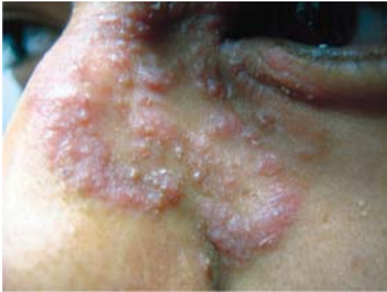
Figura 1. Aspecto clínico inicial en la nariz.