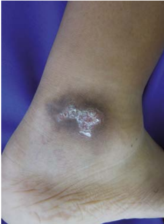
Figura 1. Micetoma en la extremidad inferior, se observa aumento de volumen y fístulas.

El diagnóstico micológico se corrobora observando los “granos” en el examen microscópico directo (el tamaño, la forma y el color orientan al agente etiológico probable). Figura 2