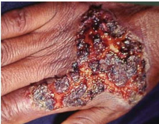
Figura 2. Lesión impetiginizada de esporotricosis diseminada.