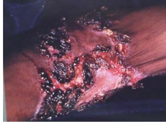
Figura 3. Acercamiento de esporotricosis diseminada.

traumatismo. La paciente refirió iniciar con una lesión exudativa en el antebrazo, posteriormente se diseminó a la mano del miembro contralateral; la paciente se aplicó remedios caseros y tratamientos no especificados que le prescribieron en el centro de salud de su comunidad, sin obtener mejoría. Este caso fue captado en las jornadas de Dermatología Comunitaria AC. Posteriormente, con el apoyo del Gobierno Estatal a través del DIF (Desarrollo Integral de la Familia), se trasladó al Hospital General de Acapulco, donde se le atendió clínicamente en el Servicio de Dermatología y Micología. Se practicó estudio micológico con examen directo con resultado negativo, el cultivo se hizo en medios de Sabouraud dextrosa agar, en el que a los siete días crecieron cepas blancas de Sporothrix schenckii , al estudio microscópico de éstas observamos filamentos delgados y septados, con conidióforos que semejaban “flor de margarita o de durazno”, así como conidios que emergían directamente de la hifa. También se practicó una biopsia de piel, con reporte histopatológico que mostró una imagen granulomatosa de tipo tuberculoides, constituida por linfocitos e histiocitos, con formación de células gigantes multinucleadas en cuyo interior se observaron levaduras en forma de cigarro (Figura 4).