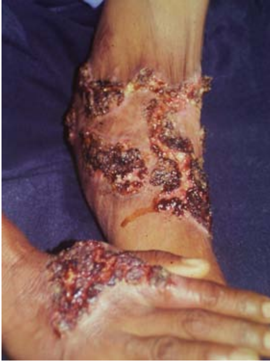
Figura 1. Panorámica de las lesiones de esporotricosis diseminada.