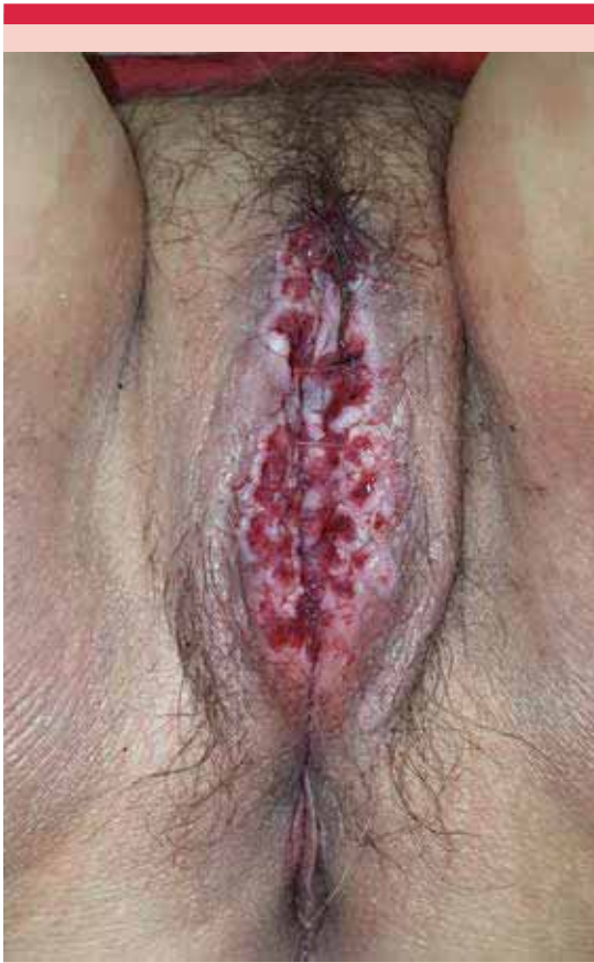
Figura 1. Aspecto inicial de la lesión, obsérvese la gran cantidad de exulceraciones y el exudado mucoso sobre los labios mayores.