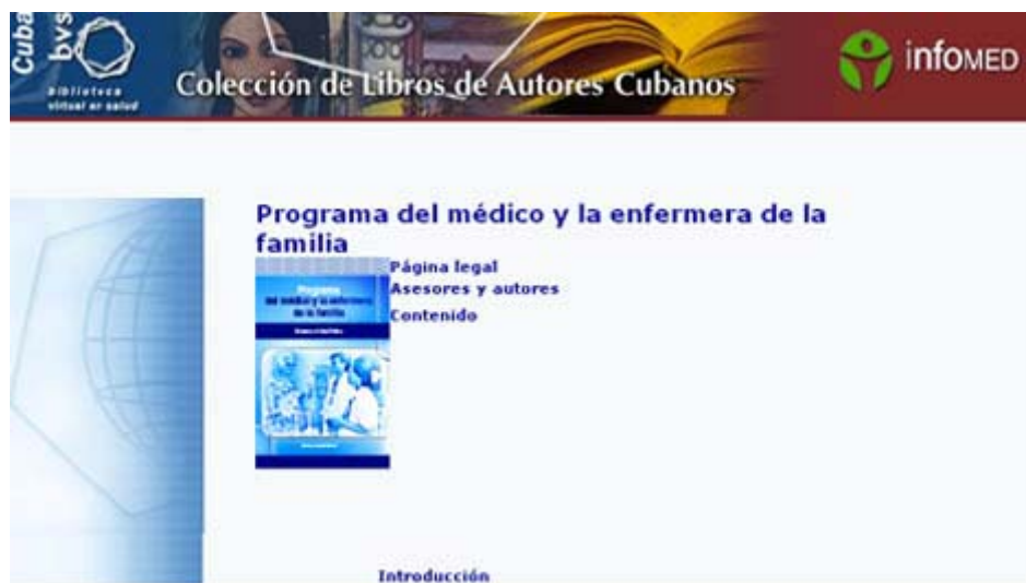
Fig. 1. Programa de Medicina General Integral.

http://www.bvs.sld.cu/libros/programa_med_enf_familia/indice_p.htm (Fig. 1).