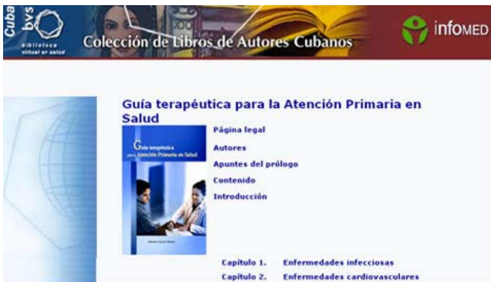
Fig. 3. Guía Terapéutica para la Atención Primaria de Salud.