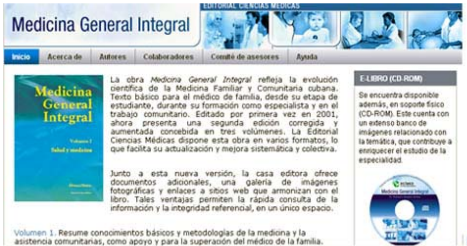
Fig. 2. Portal Libro Medicina General Integral.