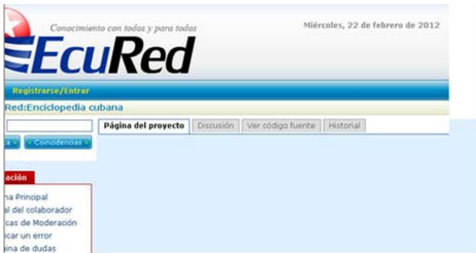
Fig. 7.

La Atención Primaria de Salud, actualmente en Cuba, está en una fase desarrollo y perfeccionamiento. Se encuentran acreditados los escenarios docentes en los Policlínicos y Consultorios del Médico y Enfermera de la Familia, las clínicas estomatológicas y otros espacios que garantizan que el estudiante adquiera los conocimientos y habilidades requeridas para alcanzar las competencias adecuadas para ese nivel de atención. Les dejamos con nuestra invitada, quien seguramente aportará novedosos criterios sobre este tema tan importante en la actualidad nacional e internacional.