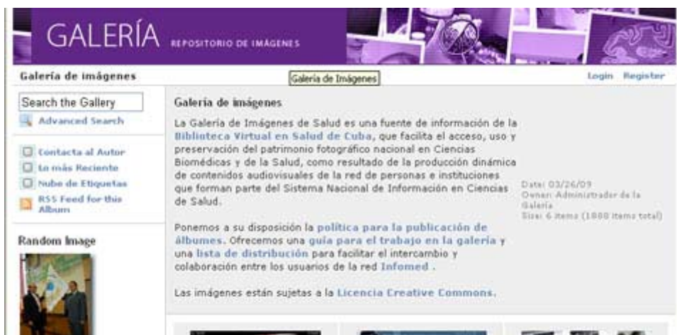
Fig. 4. Galería de imágenes.