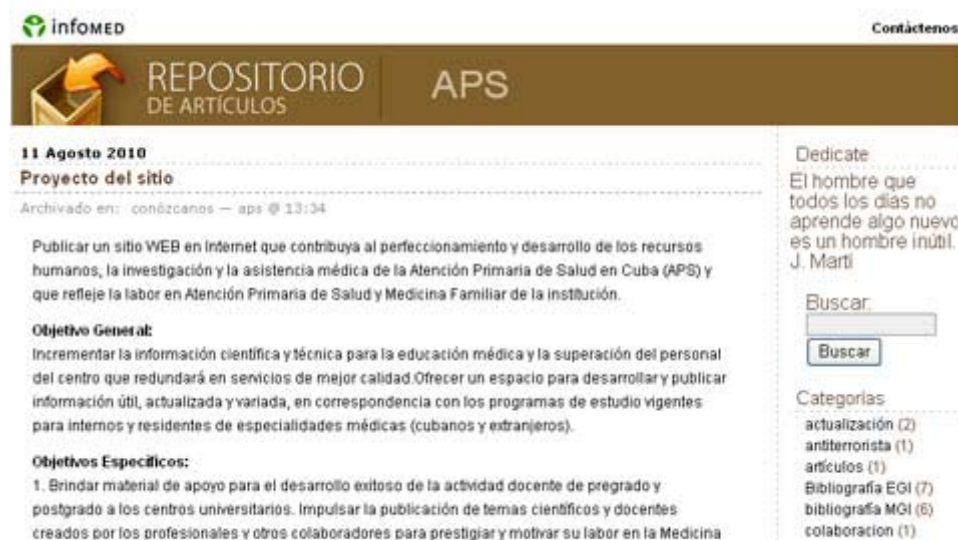
Fig. 6. Repositorio de Artículos de Atención Primaria de Salud.

- Repositorio de artículos de APS. Sitio Web que contribuye al perfeccionamiento y desarrollo de los recursos humanos, la investigación y la asistencia médica de la Atención Primaria de Salud en Cuba. http://articulos.sld.cu/aps/2010/08/11/proyecto-del-sitio/ (Fig. 6).