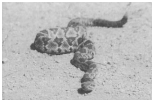
Figura 4. Nombre común: Cascabel Cola Prieta Especie: C. molossus M. Longitud (cm): 80-120 Producción de veneno (mg): 120-240 DL50 mgxkg: 7.0

dimetilpirazolona y acetaminofen en 24 (43.6%), incisión y succión en cinco (9.0%), gluconato de calcio en uno, incisión y aplicación de torniquete en 10 (18.1%), aplicación de suero antiviperino, de uno a dos frascos vía intramuscular; en 27 pacientes (49%); recibieron antihistamínico más hidrocortisona 21 (38.1%), dos no recibieron tratamiento (3.6%), a uno se le aplicó hielo y a otro paciente le practicaron incisiones múltiples menores de 1 cm. para tratar de disminuir el edema.