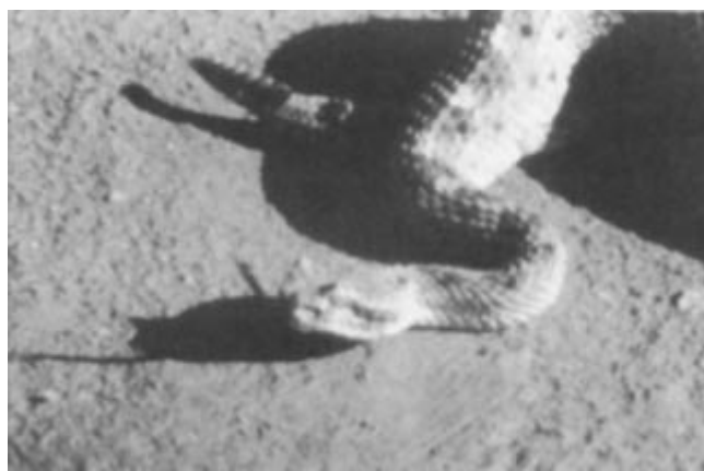
Figura 2. Nombre común: Víbora de Cuernitos Especie: C. cerastes c Longitud (cm): 40-80 Producción de veneno (mg): 20-40 DL50 mgxkg: 4.0