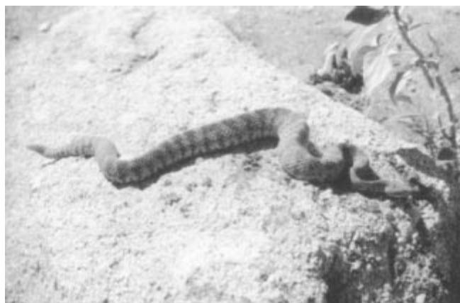
Figura 3. Nombre común: Cascabel Pinta Atigrada Especie: C. trigirs Longitud (cm): 100-120 Producción de veneno (mg): 30-80 DL50 mgxkg: 2.0