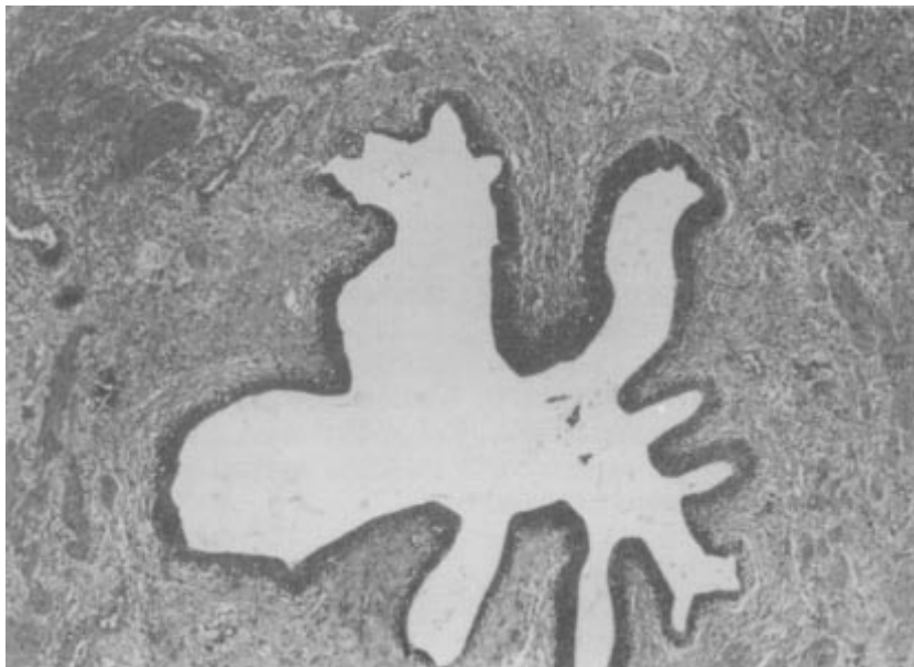
Figura 4. Corte microscópico del tumor ureteral derecho que muestra la luz ureteral, la mucosa y la pared del mismo sustituida por el tumor compuesto por tejido colágeno, fibroblastos abundantes, vasos de neo-formación, linfocitos, histiocitos y células plasmáticas sin atipia.

diagnóstico adecuado. Los hallazgos histológicos descritos por Bahadori y Liebow en 1973 son proliferación local de células plasmáticas maduras, linfocitos, células mononucleares gigantes y abundantes fibroblastos con actividad mitótica normal. 17 La historia natural no ha mostrado la presencia de metástasis a distancia, sin embargo, a pesar de que generalmente son benignos existen dos casos reportados por Coffin y colaboradores de pseudotumor inflamatorio con transformación maligna a un sarcoma indiferenciado. En ambos casos la presen-