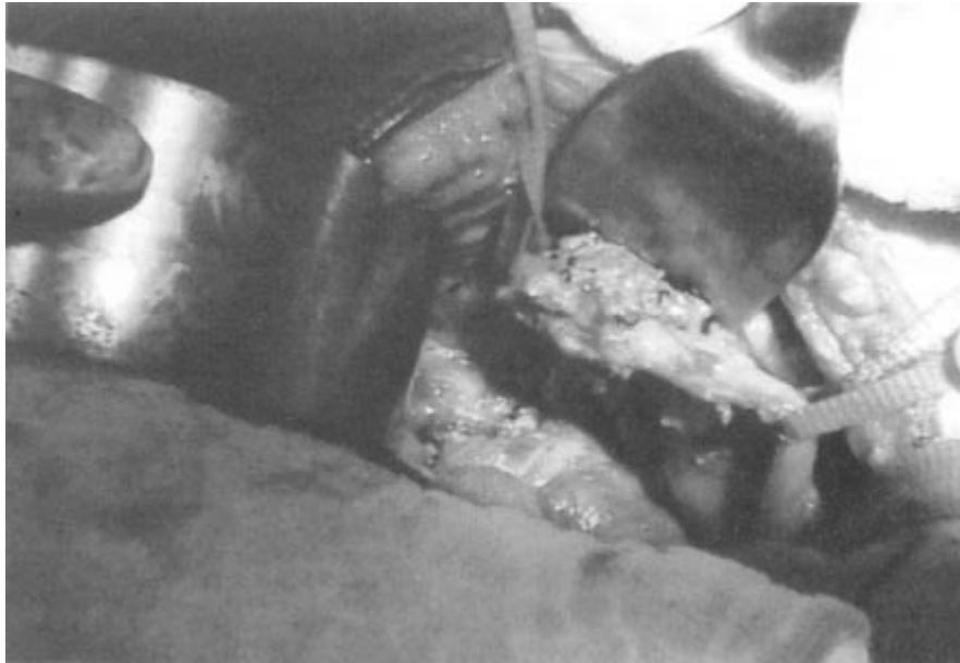
Figura 3. Apariencia transoperatoria del tumor ureteral derecho.

tación, esta lesión se encuentra con mayor frecuencia en niños y adultos jóvenes. 14 La etiología es aún desconocida aunque recientemente se ha identificado en estos pacientes la presencia de virus Epstein-Barr. 15 El cuadro clínico y los hallazgos radiológicos generalmente sugieren una neoplasia maligna que se caracteriza por tumores de dimensiones variables que aparentan involucrar estructuras adyacentes con áreas de necrosis y hemorragia, aumento de la vascularidad y rara vez calcificaciones. 16 Sólo el estudio histopatológico permite realizar un