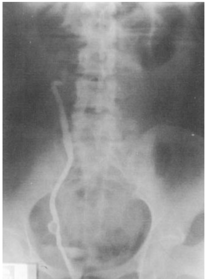
Figura 1. Pielografía retrógrada con tumor ureteral derecho de 2 cm de diámetro.

Paciente femenino de 32 años de edad con antecedente de cirugía lumbar por hernia de disco. Inició su padecimiento dos semanas previas a su ingreso con dolor leve en fosa ilíaca derecha que manifestaba como "inflamación". Una semana después se agregó hematuria macroscópica silente, intermitente, acompañada de coágulos; su estudio se inició por consulta externa. Sin embargo, presentó hematuria importante en forma aguda que la llevó a la pérdida del conocimiento, lo que originó su ingreso al servicio de urgencias del hospital donde se estabilizó hemodinámicamente. En la exploración física se encontró el abdomen con dolor leve a la palpación en fosa ilíaca