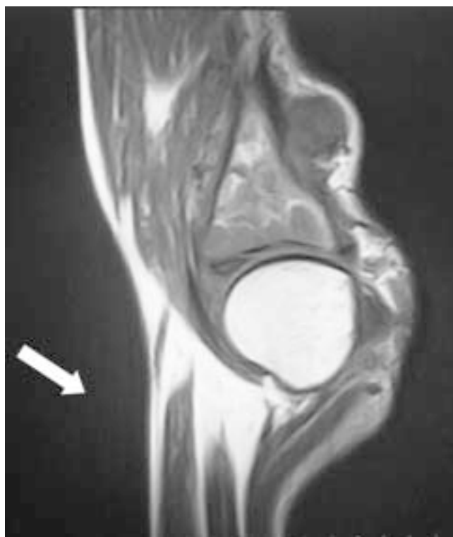
Figura 2. Resonancia magnética ponderando la secuencia de densidad de protones con un corte sagital de rodilla, en la que se observa lesión hipointensa con afectación de tejidos blandos pretibiales y a la tibia.

De acuerdo con estos criterios se incluyeron un total de 11 casos (que representó 8% del total de pacientes con CaRCC tratados inicialmente como localizados al riñón en el Instituto), con distribución por sexo de 7 hombres y 4 mujeres, y edades que variaron de 42 a 77 años (promedio de 54.8 años). Todos los casos fueron diagnosticados inicialmente como cáncer renal localizado y sometidos a nefrectomía radical. El informe histopatológico correspondió a CaRCC de patrón histológico convencional, con grados de diferenciación de Furhman de II a IV, clasificados por el sistema TNM al inicio como enfermedad organoconfinada (T2), y en los que posteriormente se detectó la presencia de metástasis únicas en órganos diferentes a pulmón, hueso o hígado por ser los sitios más frecuentes de progresión. Los sitios de diseminación inusuales fueron: un caso de esófago (Figura 1), tejidos blandos de rodilla (Figura 2), amígdala, diafragma, testículo, tiroides (Figura 3) y suprarrenal; y dos casos a cerebro y a duodeno. El tiempo entre la nefrectomía y la presentación de la metástasis varió de 9 hasta 156 meses. El estudio histopatológico confirmó el diagnóstico en todos los casos y fueron sometidos a resección de la lesión. (Cuadro I)