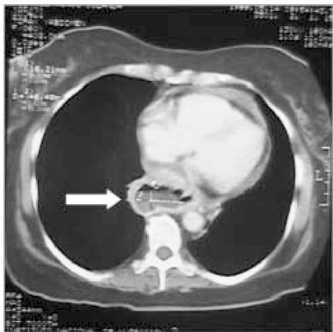
Figura 1. Tomografía axial contrastada con corte a nivel de mediastino, en la que se visualiza lesión hipodensa que ocupa y disminuye la luz del esófago, con afectación de la capa muscular del mismo, que corresponde al caso de metástasis de CaRCC a esófago.

En el presente estudio se evaluaron los diferentes sitios de metástasis poco comunes de CaRCC que se han diagnosticado y tratado en los últimos 15 años en el Instituto Nacional de Ciencias Médicas y Nutrición "Salvador Zubirán" para tratar de identificar algún patrón o explicación de la forma de metastatizar de esta neoplasia.