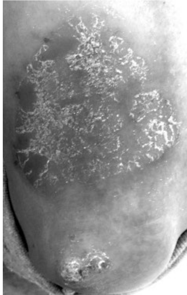
Figura 1. Psoriasis en placas. Lesión en el antebrazo de un paciente con psoriasis.

Siguiendo el proceso diagnóstico (T2), solo el 42% fue diagnosticado en el mismo año de inicio de la