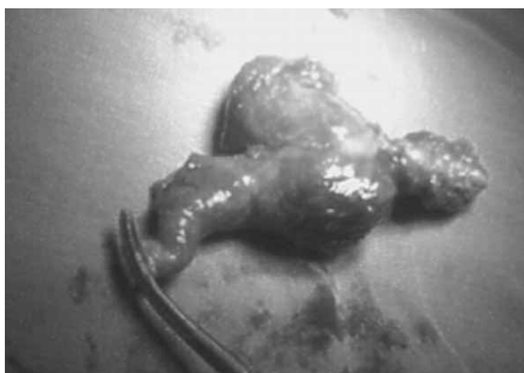
Figura 3. Apéndice cecal con tumoración dependiente de la misma, de aproximadamente 5 x 5 cm

Álvaro José Montiel-Jarquín et al. Apendicitis crónica