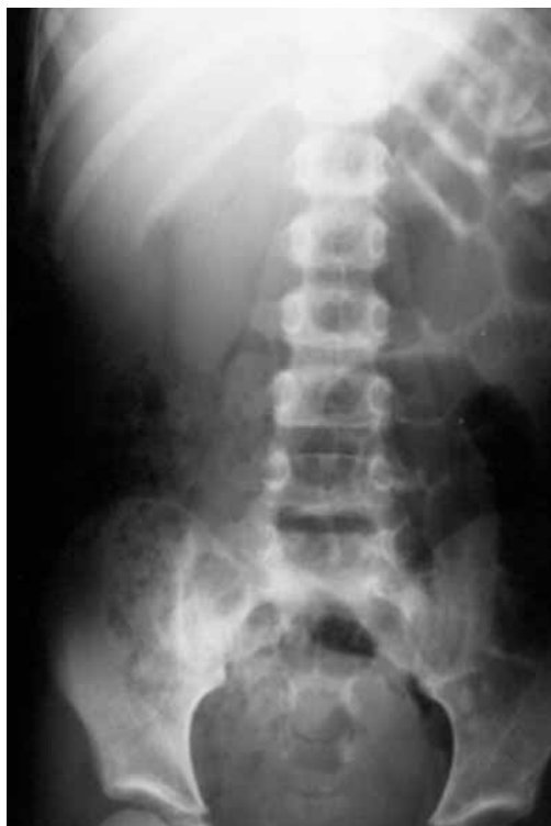
Figura 1. Asa fija de intestino delgado con abundante material fecal a nivel de ciego

diagnóstico presuntivo mediante ultrasonido de fosa iliaca derecha o tomografía axial computarizada, y al definitivo a través de estudio histopatológico del apéndice cecal. 5 En la evaluación de un paciente con dolor abdominal, una historia de episodios similares no excluye el diagnóstico de apendicitis aguda, crónica o recurrente. 5