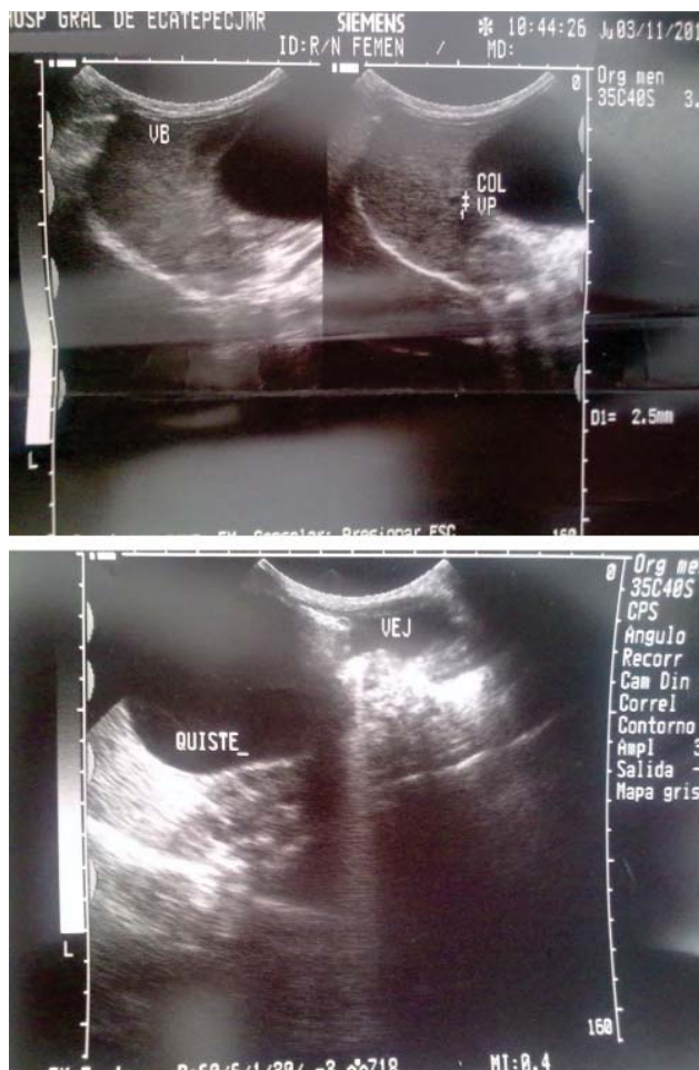
Figura 2. Lesión quística en epigastrio de 6 x 5 cm bien limitada, de superficie regular y consistencia blanda con hígado y vesícula normales, sin dilatación de vía biliar intra y extrahepática.

Respecto a los estudios de imagen, se sugiere que en definitiva estén orientados con base en la historia clínica y exploración física, siguiendo un orden de aplicación de los estudios, donde los rayos X simples sean los que den la orientación para la presencia de masa, una vez que a la exploración física fuese detectada. Posteriormente se solicitan estudios de ultrasonografía y tomografía abdominal que distinguirán entre la masa sólida y quística, proporcionando además la localización. Se deberá de limitar si está en el retroperitoneo o en abdomen y si depende o no de una estructura vascular o de la pared intestinal, para lo cual se hace indispensable realizar los estu-