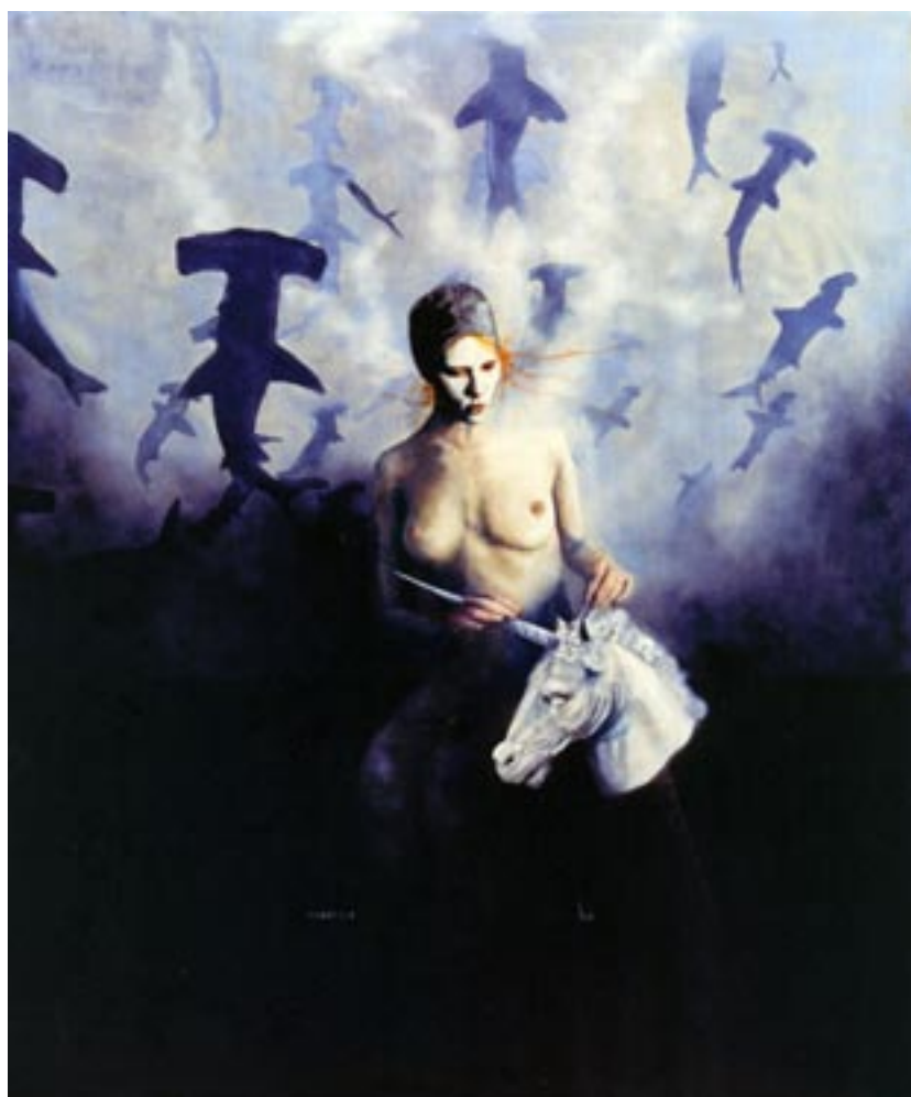
Carlos Larracilla/Virgen y unicornio