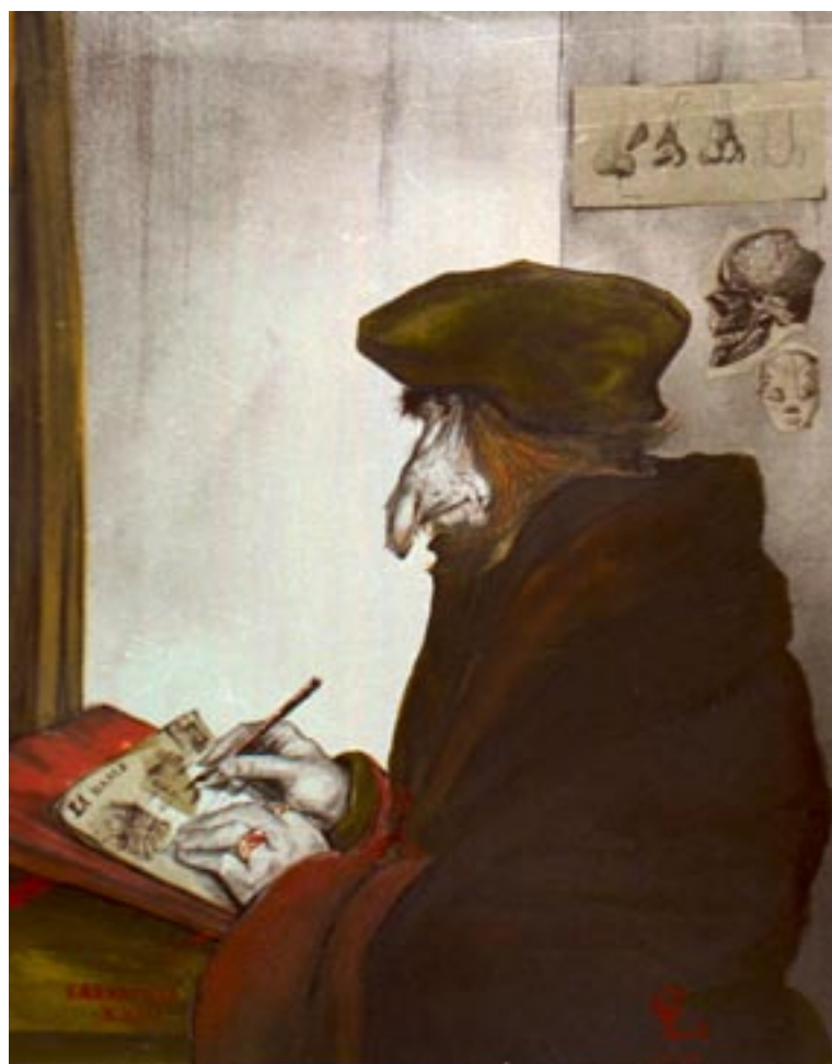
Carlos Larracilla/La nariz