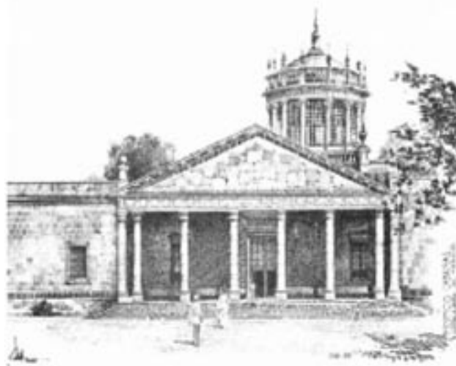
Hospicio Cabañas

La beneficencia y la asistencia en la salud tomaron una giro político e ideológico en el periodo de Lázaro Cárdenas (1932-1934) quien dio al gobierno un tinte socialista,