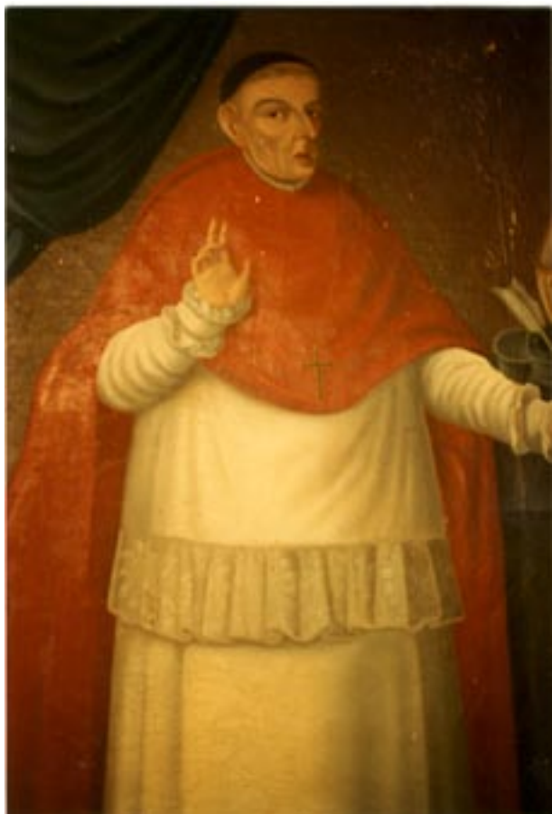
Fray Antonio Alcalde

Sin embargo en el siglo XVII aun se continuaban manifestando los efectos de la catástrofe, en la población indígena que continuaba descendiendo a su nivel mas bajo, hasta el grado de pedir permiso para vender sus tierras “para pagar el rezago de tributo y el servicio real de sus familiares muertos y ausentados de los viejos impedimentos de tributar”, en este momento los caciques aprovechaban la muerte de los indios para invadir y ocupar sus tierras (5), ocasionando mayores problemáticas sociales, económicas y de salud en la población indígena.