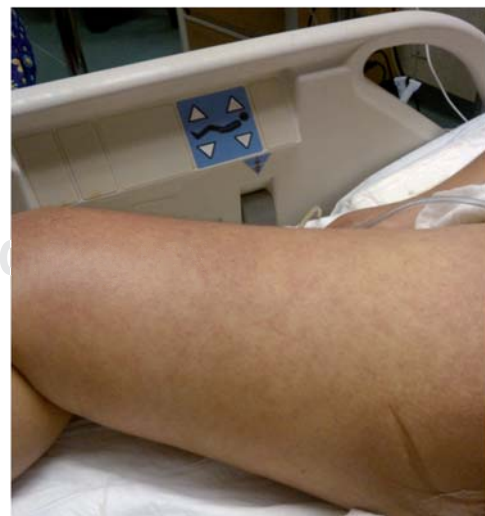
Figura 2. Eritema y Rash en miembros pélvicos.