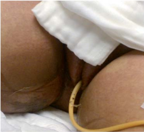
Figura 3. Descamación vulvar en el síndrome de shock tóxico.

citario y cuatro aféresis plaquetarias; no presentó sangrado. El hemocultivo fue positivo para Staphylococcus hominis . Evolucionó hacia la mejoría logrando la estabilidad hemodinámica con el retiro del vasopresor, corrección de las alteraciones hematológicas, adecuados flujos urinarios, progresión y retiro de la ventilación mecánica. Se resolvieron las fallas orgánicas y fue egresada estable de la unidad. Se estableció el diagnóstico de síndrome de shock tóxico debido a los criterios clínicos, a la falla multiorgánica, el rash, descamación de la piel así como por los exámenes solicitados presentando positividad para exotoxina 1 del Staphylococcus aureus . Su evolución fue favorable siendo egresada de la unidad estable.