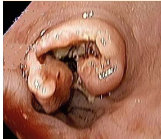
Figura 1. Endoscopia superior que demuestra una masa de aspecto neoplásico, parcialmente estenosante, con extensión circunferencial del 100%. Se localiza en la unión gastroesofágica; se extiende desde 37 cm hasta 46 cm de la arcada dentaria dentro de la cavidad gástrica.

El paciente recibió transfusiones sanguíneas, se le realizó endoscopia superior ( Figura 1 ), que reveló un tumor exofítico, friable y ulcerado en la unión gastroesofágica. La biopsia demostró un carcinoma de células pequeñas indiferenciado ( Figura 2 ); la inmunohistoquímica fue positiva para cromogranina A, sinaptofisina y CD56. La tomografía computada con contraste intravenoso confirmó el tumor, que se extendía 10.1 cm desde la porción distal del esófago hasta el cardias, con diámetro de 3.4 cm. Se encontraron además ganglios linfáticos de hasta 1.9 cm adyacentes a la curvatura menor del estómago. No se encontró evidencia de tumoración en pulmones ni metástasis a distancia. Se realizó resonancia magnética de cerebro con contraste intravenoso sin datos de metástasis.