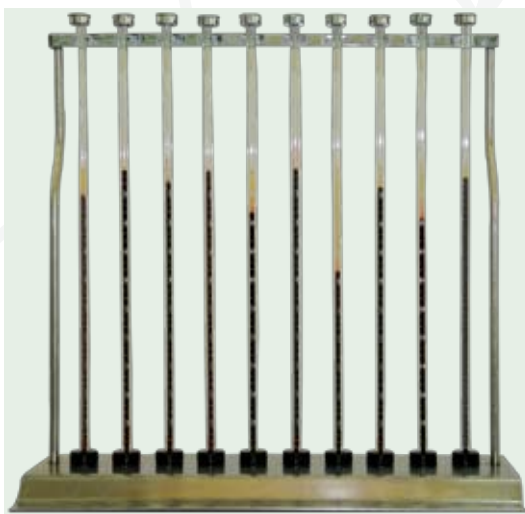
Figura 2. Eritrosedimentación con el método de Westergren, en la cual se observan los mm de desplazamiento en las muestras de los pacientes después de una hora.

El estándar de oro para medir la eritrosedimentación es el método introducido por Westergren en 1926 [16, 30, 31] que utiliza una pipeta de vidrio, diseñada para tal efecto, con una longitud de 200 mm y un diámetro interno de 2,5 mm en la cual se depositan 0,5 mL de sangre completa con anticoagulante (EDTA); la pipeta se coloca en la gradilla de sedimentación por una hora, al término de la cual se lee en mm el desplazamiento, de arriba hacia abajo, de la columna de glóbulos rojos [16], como se muestra en la figura 2 .