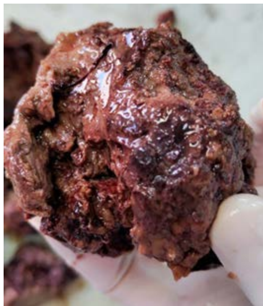
Figura 3: Biopsia mediastinal de pieza quirúrgica de 12 × 10 centímetros.

El tratamiento de primera línea en los tumores de células germinales no seminomatosos es la quimioterapia seguida de resección quirúrgica. Actualmente, el fármaco preferido para quimioterapia es cisplatino, que consigue remisión completa en 50% de los casos. El esquema de elección preferido incluye tres a cuatro ciclos de cisplatino a dosis de 20 mg/m 2 combinado con etopósido 100 mg/m 2 /día por