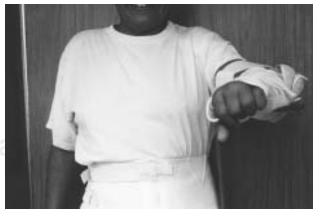
Figura 5. Inmovilización postquirúrgica del hombro.

Tres días después, se practica electromiografía que reporta: lesión del plexo braquial izquierdo del tipo axonotmesis en el nivel de troncos primarios. Polineuropatía de tipo desmielinizante segmentaria leve.