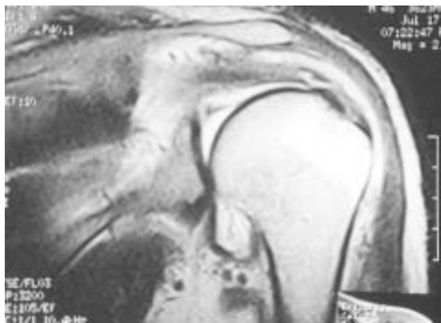
Figura 2. Cambios osteoartroticos de la articulación.

a su primera consulta, caracterizado por dolor intenso y constante en hombro izquierdo, el cual fue manejado previamente con esteroides intraarticulares por síndrome de pinzamiento del hombro en otra unidad hospitalaria, sin presentar mejoría, por lo que acude a revisión a nuestro hospital el 16 junio-00; encontrándose a su primera visita: hipotrofia muscular deltoidea, fuerza muscular de 3 (Daniel's). Dolor y limitación a la abducción y la rotación externa del húmero, y dolor a la digitopresión en la corredera del bíceps, y sin más alteraciones clínicas.