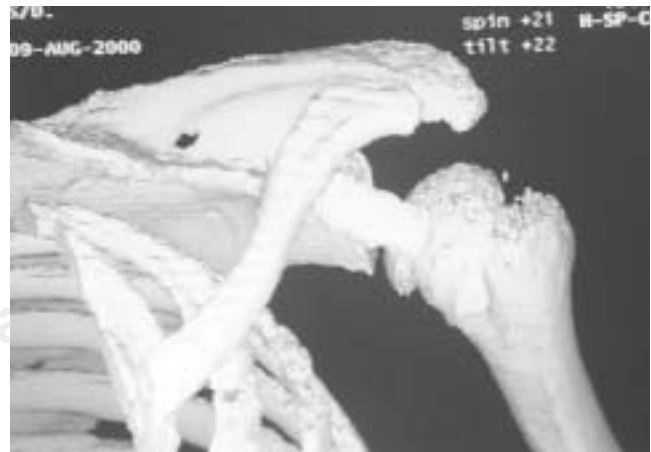
Figura 1. Reconstrucción tridimensional del hombro.

Presentamos el caso de un paciente masculino de 46 años de edad, con antecedente de diabetes mellitus tipo II en tratamiento, que presenta un cuadro de 2 meses previos