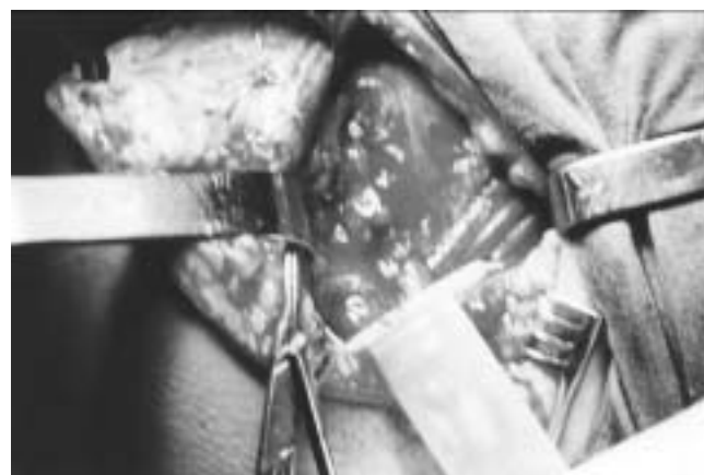
Figura 4. Vista transoperatoria de la cápsula articular.

la cabeza humeral, así como presencia de edema: tenosinovitis de la porción larga del bíceps y del subescapular; cambios artróticos articulación acromio-clavicular con tendencia a la formación osteoartrotica inferior que produce compresión sobre el trayecto del supraespinoso, concluyendo el estudio con diagnóstico de síndrome de pinzamiento ( Fig. 2 ).