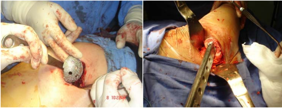
Figura 2. Izquierda: Separación con instrumental convencional para la colocación de la copa acetabular. Derecha: Inicio de la preparación femoral.

rugía, cirugía programada, cirugía realizada, abordaje empleado, sangrado transoperatorio, transfusión transoperatoria, sangrado postoperatorio, longitud inicial de la incisión, longitud terminal de la incisión, cambios de coloración de los bordes de la piel, inicio de apoyo parcial a la marcha con uso de andadera, inicio de apoyo total a la marcha con uso de andadera, reincorporación a sus actividades cotidianas, valoración preoperatoria con la escala de Harris, valoración postoperatoria con la escala de Harris a las ocho semanas.