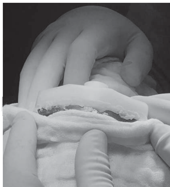
Figura 3. Cementado del nuevo inserto de polietileno al componente tibial.