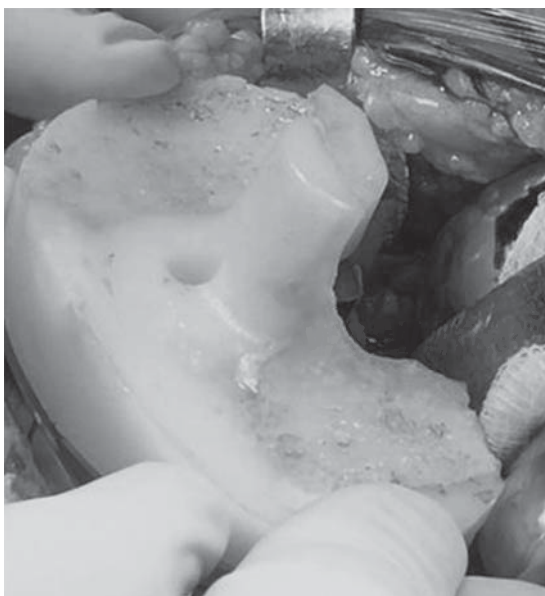
Figura 2. Inserto de polietileno original con desgaste de predominio posterior.