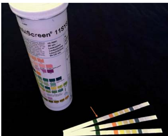
Figura 1. Tira reactiva COMBI-SCREEN 11SYS (Analyticon Biotechnologies, Alemania); se marca la segunda almohadilla correspondiente a la determinación de esterasa leucocitaria.

La lectura se estableció a los 120 segundos de acuerdo a recomendaciones del fabricante y se clasificó de la siguiente manera: negativo (blanco), trazas (violeta muy tenue), + (violeta claro) y ++ (violeta oscuro) (Figura 2). Los resultados, tanto del test de esterasa leucocitaria como del cultivo, se vaciaron en una cédula y se agregaron al expediente clínico de los pacientes.