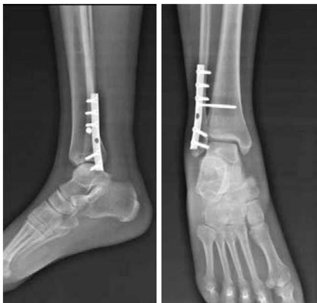
Figura 1. Uso de tornillo de situación.

Se reclutaron 43 pacientes (22 mujeres y 21 hombres) con diagnóstico de fractura de tobillo B de Weber con lesión