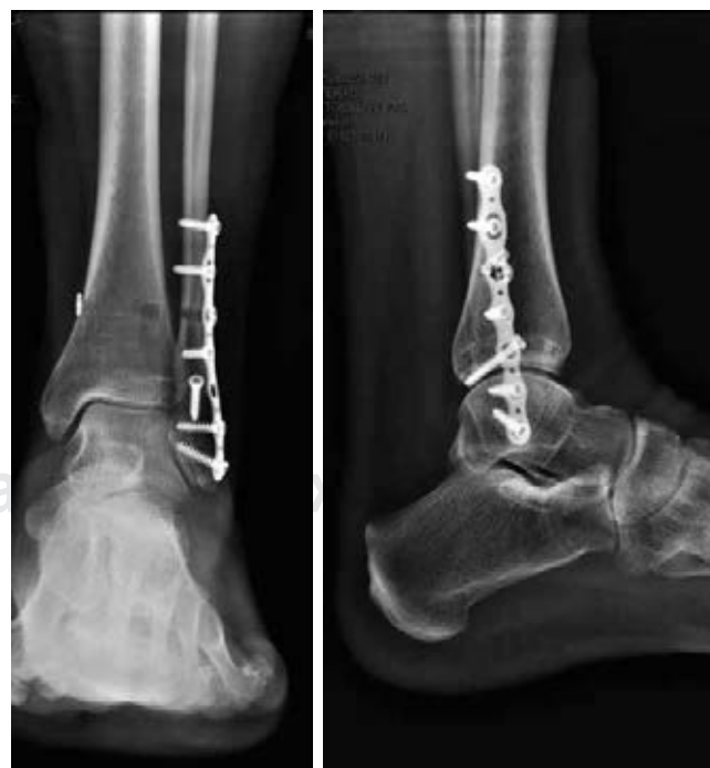
Figura 2. Uso de TightRope.