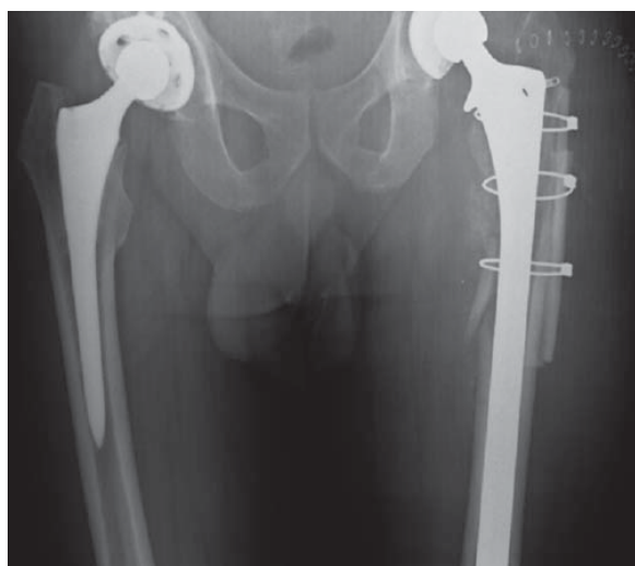
Figura 5. Control postquirúrgico.

óseo con cerclaje con cables de acero, se conserva componente acetabular, se colocan 30 cm 3 de injerto óseo en chips a nivel de foco de fractura y se coloca drenovac 1/8 con adecuado control radiográfico ( Figura 5 ). Se retira el drenovac dos días después, se reportan resultados de cultivos negativos y es egresado el día 07 de Octubre de 2015 con apoyo diferido. Se retiran suturas a las dos semanas sin complicaciones.