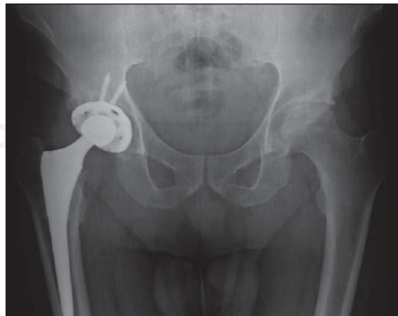
Figura 2. Control radiográfico. Junio 2015.