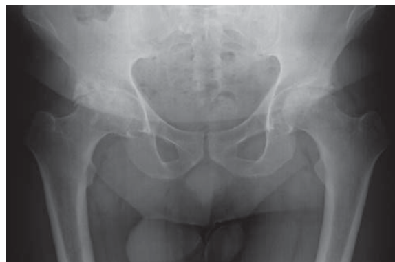
Figura 1. Radiografía AP de pelvis preoperatoria. Agosto 2014.

El día 02 de Octubre de 2015 se efectúa revisión de componente femoral de prótesis total de cadera izquierda. Se encuentra componente femoral con hundimiento, foco de fractura en fémur proximal multifragmentado, sin datos de consolidación, con cerclaje con alambre, se toman muestras de cultivo y se retira vástago femoral. Se rima tercio distal del fémur hasta rima 16, se coloca vástago femoral de revisión tipo Echelon no cementado de 16 x 10 x 280 mm con fijación diafisaria, se reducen fragmentos de fractura y se fijan con tres lajas corticales de aloinjerto