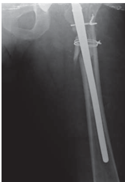
Figuras 3 y 4. Radiografía de control en urgencias. 10 de Septiembre de 2015.