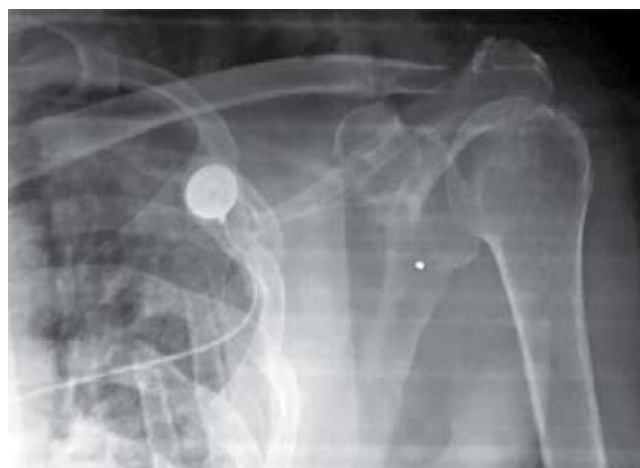
Figura 2: Imagen radiográfica en la que se puede apreciar la alineación de la clavícula posterior a la reconstrucción de los ligamentos coracoclaviculares con un ancla corkscrew .

Se encontraron 50 pacientes con diagnóstico de fractura de la clavícula; de estos, 12 correspondían a fracturas localizadas en el tercio distal de la misma, representando 24% de los casos. La distribución por sexos fue de 10:2 en cuanto a hombres:mujeres. El hombro en el cual se presentó principalmente este padecimiento fue el izquierdo, con ocho casos; sólo cuatro se observaron en el lado derecho.