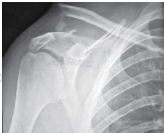
Figura 1: Imagen radiográfica de una fractura del tercio lateral de la clavícula en la que podemos observar el desplazamiento del fragmento medial hacia superior y posterior por efecto de los músculos trapecio y esternocleidomastoideo. El peso del brazo desplaza el fragmento lateral.

La técnica de reparación de cerclaje coracoclavicular entre la clavícula y el proceso coracoides indirectamente promueve la reducción y estabilización de la fractura con poco