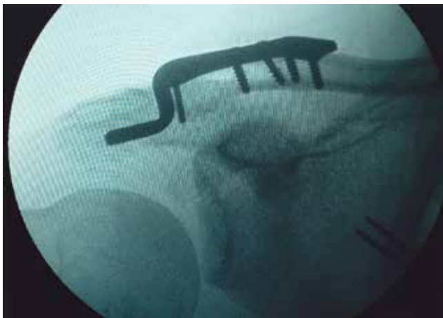
Figura 3: Imagen fluoroscópica de una fractura del tercio lateral de la clavícula tratada con placa gancho.

La osteosíntesis de fracturas del tercio lateral de la clavícula con placa gancho ha demostrado un porcentaje de éxito de hasta 95% de los casos; el uso de este tratamiento se ejemplifica en las Figuras 3 y 4 . Se recomienda, en todos