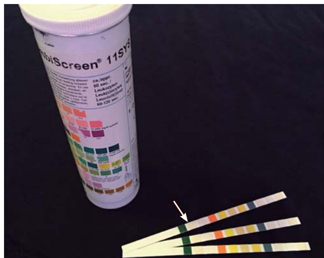
Figura 1: Tira reactiva COMBI-SCREEN 11SYS (Analyticon Biotechnologies, Alemania), se marca la segunda almohadilla correspondiente a determinación de esterasa leucocitaria.

La lectura se estableció a los 120 segundos de acuerdo con las recomendaciones del fabricante y se clasificó como: negativo (blanco), trazas (violeta muy tenue), + (violeta claro) y ++ (violeta oscuro) (Figura 2). Los resultados tanto del test de esterasa leucocitaria como de cultivo se vaciaron en una cédula y se agregaron al expediente clínico de los pacientes.