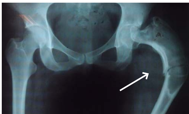
Figura 3: Fractura subtrocanterica en sitio de displasia de fémur proximal, deformidad en varo en el sitio de lesión.

Sistema modular de revisión femoral arcos MR (Biomet MR ).