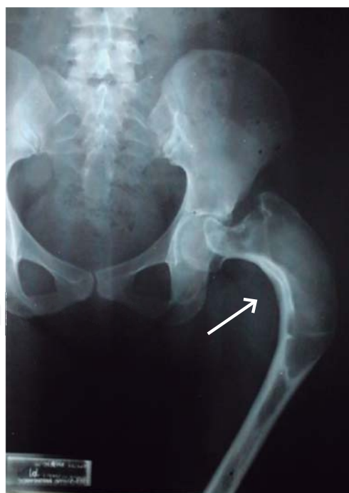
Figura 1: Deformidad en «cayado de pastor» del fémur proximal izquierdo.

Femenino de 30 años de edad con fractura de cadera izquierda a los 15 años de edad no asociada a evento traumático, el manejo fue conservador y la paciente presentó discrepancia en la longitud de ambas extremidades inferiores por acortamiento del lado afectado. A los 29 años de edad, la paciente se embaraza, durante este tiempo el acortamiento de la extremidad afectada aumentó 5 cm. La radiografía de pelvis mostró deformidad radio-opaca en cabeza femoral izquierda en «cayado de pastor» ( Figura 1 ), datos confirmados por tomografía axial computarizada ( Figura 2 ), por lo que se solicitó valoración por endocrinología manejándola con bifosfonatos y su embarazo concluyó adecuadamente.