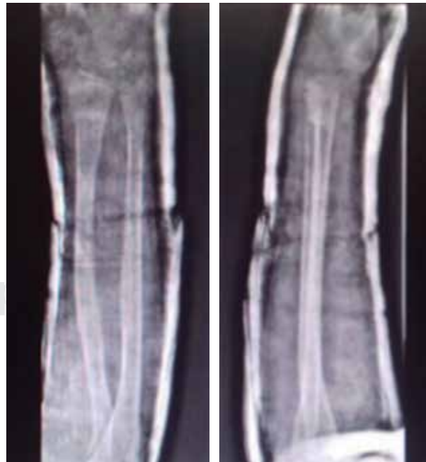
Figura 2: Control post-reducción cerrada e inmovilización con yeso circular.