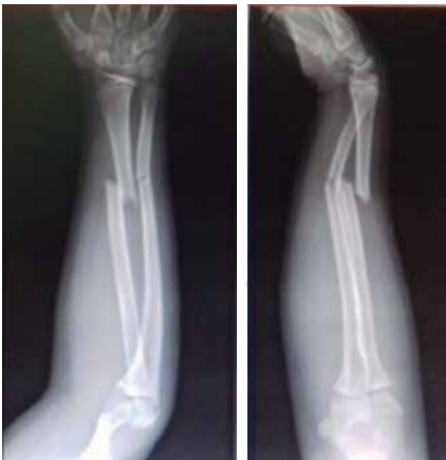
Figura 1: Radiografía anteroposterior y lateral de antebrazo. Fractura diafisaria distal.

Se obtuvo en total 2,794 expedientes con la búsqueda inicial (fractura de antebrazo, fractura de radio, fractura de cúbito y fractura radiocubital). Descartando 729 por tener un expediente incompleto y 1,143 por ser mayores de 16 años.