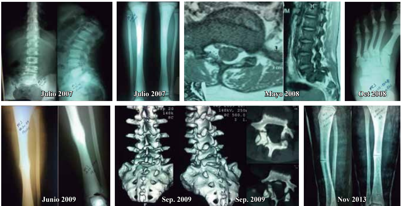
Figura 3: Resumen del expediente radiográfico del caso 1. JMFC. Léase el texto para mayor referencia.

en muslo derecho, detectándose además, nueve meses después, en Enero de 2011, fatiga de material de osteosíntesis, por lo que se decide retiro del mismo. En Mayo de 2014, a la edad de 16 años, presenta, por tercera ocasión fractura diafisaria de tibia izquierda, se le manejó en forma conservadora, sin complicaciones ni secuelas funcionales aunque con angulación anterior ( Figura 4 ).