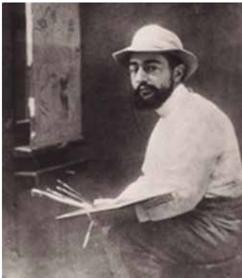
Figura 1: Henri Marie de Toulouse-Lautrec-Monfa.

Henri Marie Raymond de Toulouse-Lautrec-Monfa, nació el 24 de Noviembre de 1864, en el centro de Albi, en Francia y fue el primogénito de una de las familias aristocráticas más importantes de ese país. A los 14 años de edad sufrió una caída mientras jugaba y a pesar de no ser aparatosa, se fracturó el fémur izquierdo ( Figura 1 ).