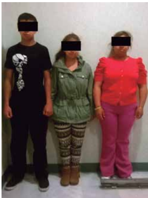
Figura 5: Fotografía casual de la familia. Se les permitió no utilizar bata clínica respetando su preferencia y manteniendo en anonimato su identidad.

Caso 3: Hombre de 16 años, producto de la tercera gesta, a quien identificamos con las iniciales BFC, soltero, sin hijos, estudiante de preparatoria. Jamás ha presentado una fractura a pesar de encontrarse también afectado ( Figura 5 ).