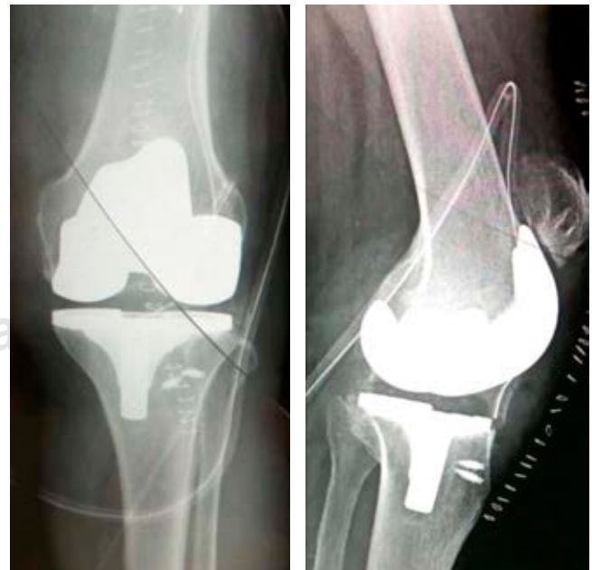
Figura 4: Radiografía postquirúrgica con colocación de prótesis primaria.