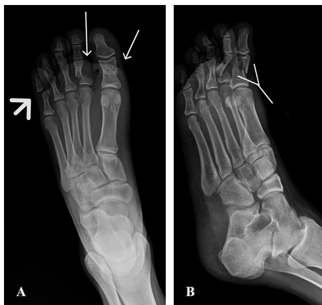
Figura 2: A) Radiografía anteroposterior de pie derecho, con fractura transversa de falange proximal de hallux y del segundo dedo (flechas delgadas blancas). Luxación interfalángica de quinto dedo (cabeza de flecha). B) Radiografía oblicua de pie derecho, con angulación no tolerable de ambas fracturas (flecha en Y).

En caso de fracturas con inestabilidad (conminución, segmentarias, mala calidad ósea, trazos bicondilares) con alto riesgo de pérdida de la reducción, el uso de implantes más rígidos permite mantener la alineación durante el proceso de rehabilitación hasta alcanzar la consolidación de la fractura, disminuyendo la posibilidad de pérdida de la reducción y falla en el manejo. 27 Los sistemas de miniplacas pueden ser convencionales o bloqueados; estos últimos se utilizan principalmente en las fracturas de pacientes con osteoporosis y/o conminución. 25