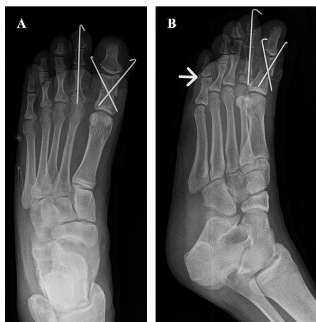
Figura 3: Radiografía de control postquirúrgico de pie derecho. A) Fijación con agujas de Kirschner cruzadas en falange proximal de hallux y en segundo dedo, con implantación endomedular. B) Adecuada reducción y posición de las agujas. Luxación de quinto dedo reducida (cabeza de flecha).

Se ha descrito la técnica de reducción cerrada con vendaje de gasa alrededor de la fractura de falange proximal para mantenerla de forma rápida, no invasiva y sin necesidad de